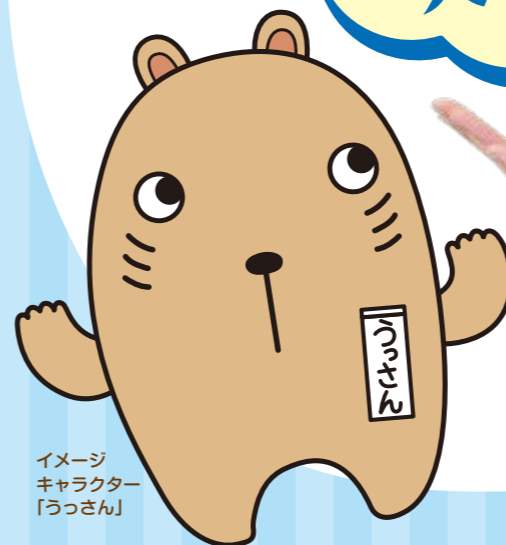
イメージ キャラクター 「うっさん」